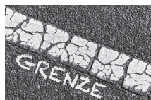
Grenzlinie, die auch schon ein mal besser ausgesehen hat

... und WENN sie einmal gezogen sind, so gelten diese Grenzen in den wenigsten Fällen für alle Zeiten.